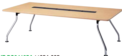
JT-RG2412BA ¥254,625 (¥242,500) 2400W × 1200D × 700H