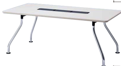
JT-RG1890BA ¥174,930 (¥166,600)