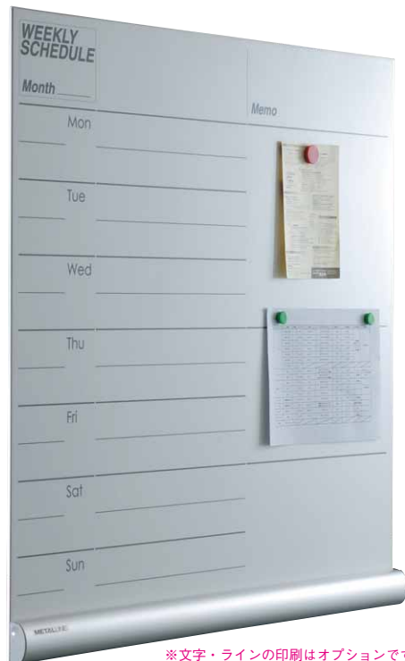
※文字・ラインの印刷はオプションです。