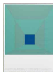
Josef Albers 額付：540×730mm 種類：プリント