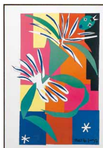
Henri Matisse 額付：700×1000mm タイトル：N48-M16 種類：プリント