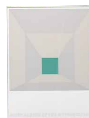
Josef Albers 額付：540×730mm 種類：プリント