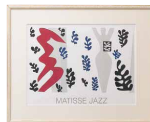
Henri Matisse 額付：1000×800mm タイトル：N47-M564 種類：プリント