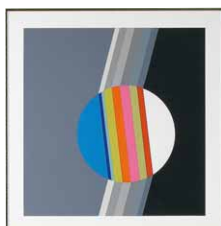
Eugenio CARMi 額付：715×740mm 種類：プリント