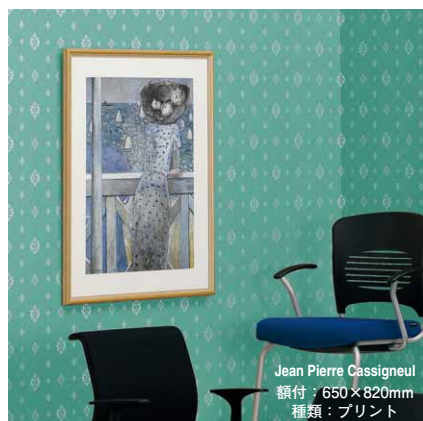
Jean Pierre Cassigneul 額付：650×820mm 種類：プリント