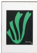
Henri Matisse 額付：500×720mm 種類：プリント