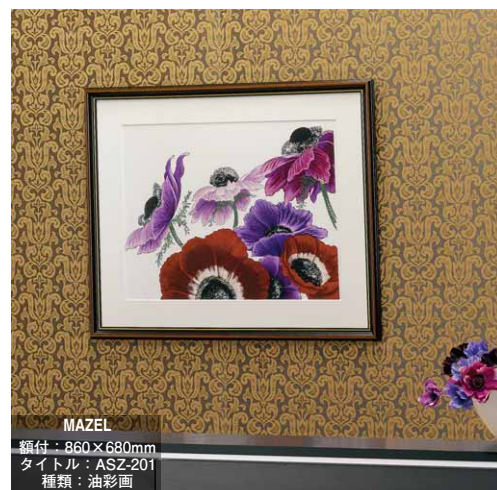
MAZEL 額付：860×680mm タイトル：ASZ-201 種類：油彩画