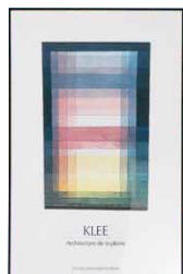
Paul Klee 額付：520×800mm 種類：プリント