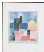
Paul Klee 額付：540×630mm 種類：プリント

くろがねは、オフィスのアートワークを、働く人のための快適なオフィス環境づくりと、企業表現に欠かせない重要な要素として捉え、お客様のオフィスに最適なアートプランを行っています。