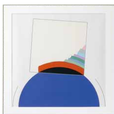
Eugenio CARMi 額付：730×730mm 種類：プリント