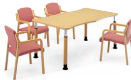
医療・福祉施設用テーブル P595