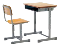
生徒用デスク・チェア P603