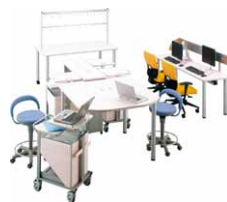
スタッフステーション家具 P594