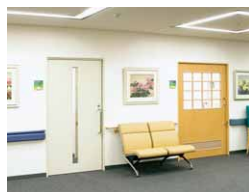
アキュドユニット P588