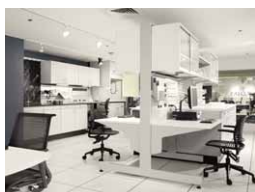
Lab Bench P596