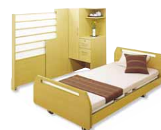
MMシリーズ木製収納家具 P595