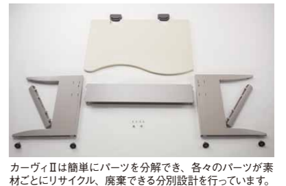
カーヴィⅡは簡単にパーツを分解でき、各々のパーツが素材ごとにリサイクル、廃棄できる分別設計を行っています。