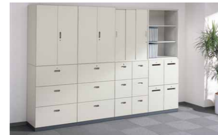
イオキャビネット

くろがねでは限りある資源をより有効に活用するため、部品点数の削減と単一素材化を追求した設計を行っています。例えばイオキャビネットシリーズは両開き扉やラテラルファイルの取手に樹脂を使用していません。このほかにも様々な商品で、リデュースを展開。もちろん、ただ単に省資源化するのではなく、よりスタイリッシュなデザインで、かつ機能性も十二分に追求。全ての部分で最善を尽くして生み出された商品こそが、本当の意味でベストアイテムと呼ぶことができるのかも知れません。