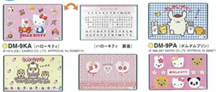
●DM-9KA (ハローキティ) © 1984,2001 SANRIO CO., LTD. APPROVAL No. SB062714 ●DM-9PA (ポムポムパン) © 1984,2001 SANRIO CO., LTD. APPROVAL No. SB062714 ●DM-9AA (ヤコクリ) © 1984,2001 SANRIO CO., LTD. APPROVAL No. SB062714 ●DM-9KZP (ハローキティ) © 1984,2001 SANRIO CO., LTD. APPROVAL No. SB062714