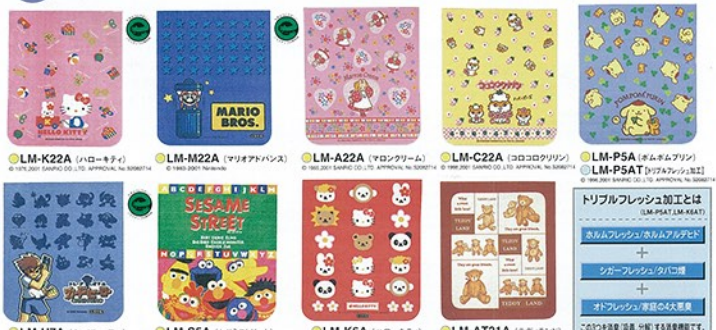
●LM-K22A (ハローキティ) © 1984,2001 SANRIO CO., LTD. APPROVAL No. SB062714 ●LM-M22A (マゾリアフانس) © 2001 Neoroll ●LM-A22A (ヤコクリ) © 1984,2001 SANRIO CO., LTD. APPROVAL No. SB062714 ●LM-C22A (コロコロクリン) © 1984,2001 SANRIO CO., LTD. APPROVAL No. SB062714 ●LM-PSA (ポムポムパン) © 1984,2001 SANRIO CO., LTD. APPROVAL No. SB062714 ●LM-PSAT (ピタパタシロ) © 1984,2001 SANRIO CO., LTD. APPROVAL No. SB062714 ●LM-H7A (カドヒーロー) © 2001 Neoroll ●LM-S5A (セサミストリート) © 2001 Neoroll ●LM-K6A (ハローキティ) © 1984,2001 SANRIO CO., LTD. APPROVAL No. SB062714 ●LM-K6AT (ピタパタシロ) © 1984,2001 SANRIO CO., LTD. APPROVAL No. SB062714 ●LM-AT21A (チキタン) © 1984,2001 SANRIO CO., LTD. APPROVAL No. SB062714 ●LM-K6AT (ピタパタシロ) © 1984,2001 SANRIO CO., LTD. APPROVAL No. SB062714

人に・環境にやさしいPO3 (特許申請中) デスクマットとは… EVAを芯材に使用し、両表面にオレフィン系熱可塑性樹脂を配した全てオレフィン系樹脂を材料としたデスクマットです。食品衛生法厚生省告示20号「ポリオレフィン等衛生協議会自主規制基準をパスした食品容器にも使用される材料を使ったPO3デスクマットです。 ① 傷 難着しにくい。 ② 耐熱性に優れ、夏・冬の温度変化が少ない。 ③ 耐油性に優れ、手洗いによる白化現象がない。 ④ キズが付きにくい。 ⑤ コピー用紙の文字の転写がない。 ⑥ 加工地場により元の反影をやわらげる。